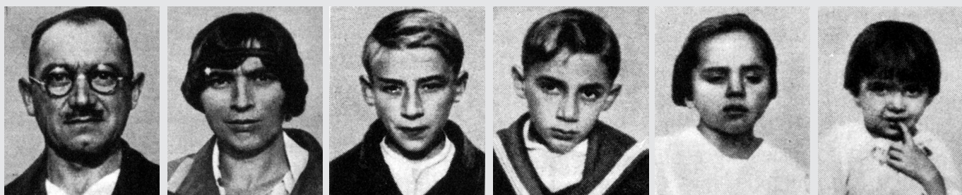
III. 5 Fotografie „cigánskej rodiny“ z článku od Guida Landra. Fotografie mali „potvrdiť“ „menejcennosť“ „Cigánov“.